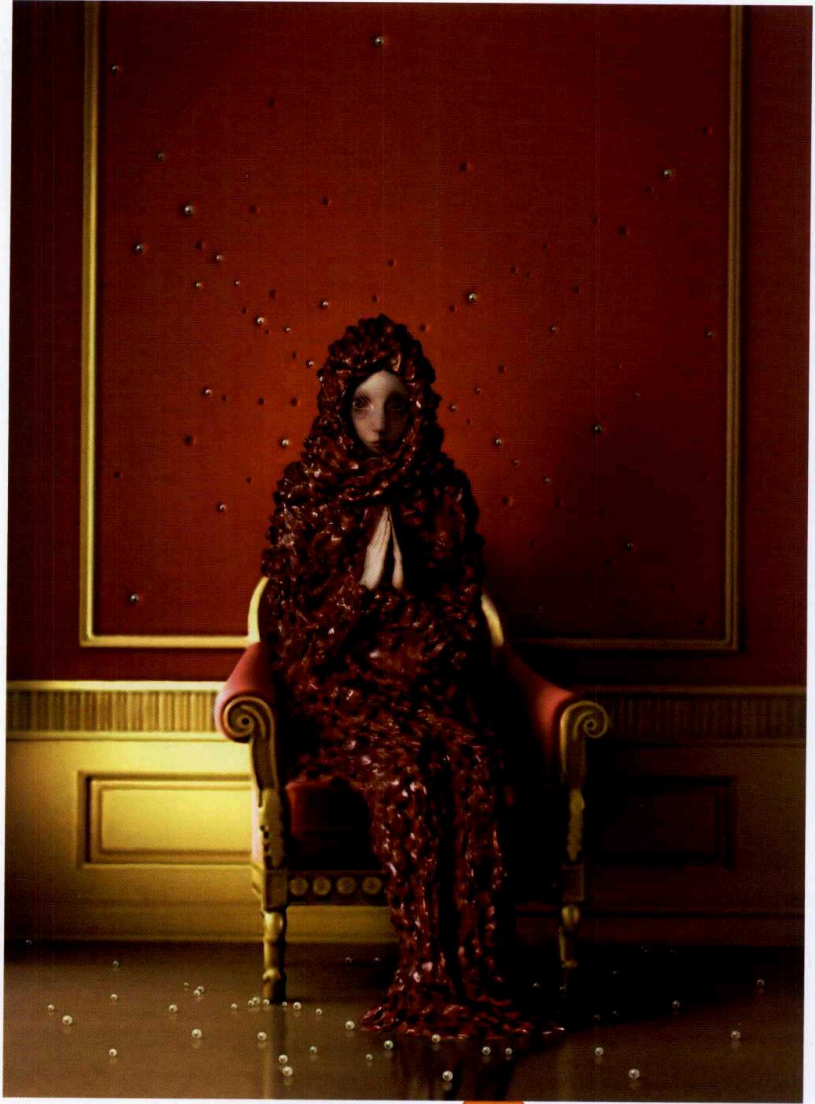
"Tevekkül" adlı resim serginin dikkat çekici parçalarından.

Beklentilerle alakalı. Sanat biraz ölüme meydan okumak gibi içgüdüsel bir refleks ya, böyle kelebek ömürlü işler yapıp onların eskimesini seyretmektense şu anda hiç olmadığım ama bir gün olmayı çok istediğim bir düzey düşünüyorum.