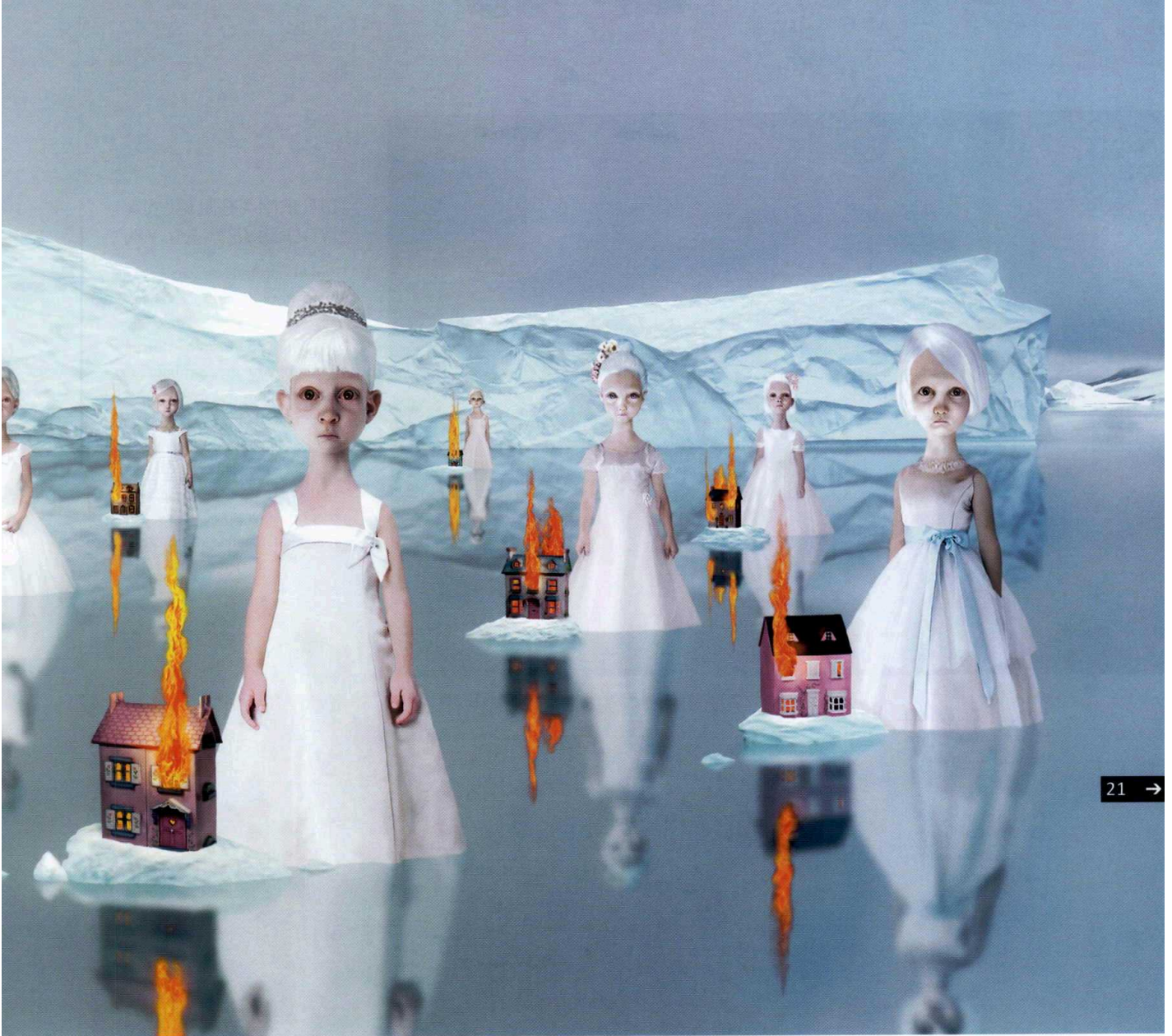
"İstikbal" adlı tablo yanan evleri ve gelinliğe benzer giysiler içindeki çocuksu figürleri gösteriyor.